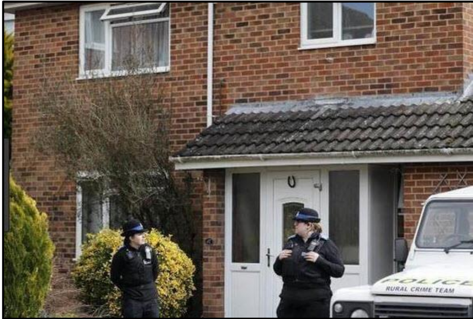
Wohnhaus der Familie Skripal in Salisbury

Von den insgesamt 195 Staaten der Welt, sind 24 dem „Aufruf zur Solidarität mit Großbritannien“ gefolgt und haben eine bestimmte Anzahl russischer Diplomaten aus ihren Ländern ausgewiesen (siehe Abbildung oben).